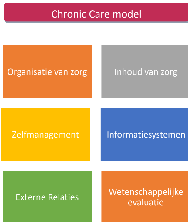
Figuur 1: Chronic Care Model met aanpassing MS Zorg Nederland

Om de optimale zorg voor mensen met MS vorm te kunnen geven is het van essentieel belang om deze optimale zorg te beschrijven. Bij het ontwikkelen en beschrijven van de optimale zorg wordt gebruik gemaakt van het Chronic Care Model (figuur 1). Klassiek kent dit model vijf pijlers waaraan MS Zorg Nederland een zesde heeft toegevoegd: wetenschappelijke evaluatie.